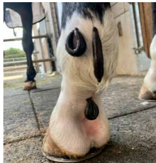
Egel kurz vor dem Trinkstopp

Bei dem Wallach wurden im Verlauf des Fesselträgers vier Blutegel angesetzt. Dies liess er geduldig zu und wurde von der Besitzerin mit Karotten abgelenkt. Nach ca. einer Stunde liess sich der erste Egel fallen. Umso weniger gut durchblutet die zu behandelnden Strukturen sind, umso länger haben die Egel, bis sie satt sind. Auch bei ihm wurde im Anschluss zum Schutz vor Fliegen ein leichter Verband angelegt. Bis zwei Tage nach der Behandlung schwellte das Bein etwas mehr an – Immunantwort des Körpers auf den Egelspeichel. In dieser Zeit durfte er die Weide geniessen. Nach drei Tagen war die Schwellung deutlich zurückgegangen. Nach zwei Wochen berichtete die Besitzerin, dass das Bein deutlich weniger angelaufen sei. Der Wallach war munter und konnte das Bein besser bewegen.