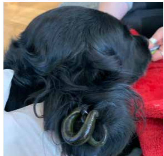
Behandlung des Blutohres mit zwei Egel

Wird ein Blutohr nicht behandelt, kann dies zu bleibenden Verformungen des Ohrs oder zu Verengungen des Gehörgangs führen. Nach mehreren Therapieversuchen mit Kortison und Ablassen des Blutes trat leider keine Besserung ein, das Ohr füllte sich jedes Mal erneut mit Blut.