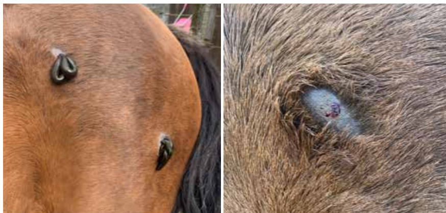
Behandlung bei Hämatomen

Der wilde Mustang war so gar nicht wild. Sichtlich dankbar und gelassen liess sie die Egelbehandlung geschehen und war dankbar für die Hilfe.