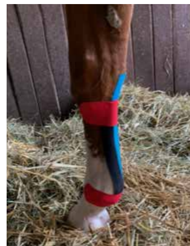
Tapeanlage bei Sehnen Schaden

2 Wochen später war das Bein deutlich weniger geschwollen. Zur Unterstützung der Heilung wurde eine spezielle Sehnentapeanlage des rechten Vorderbeines angebracht und die Meridiane mit Laserakupunktur unterstützt.