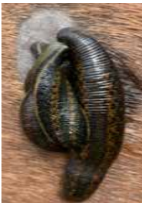
Musterung und Färbung