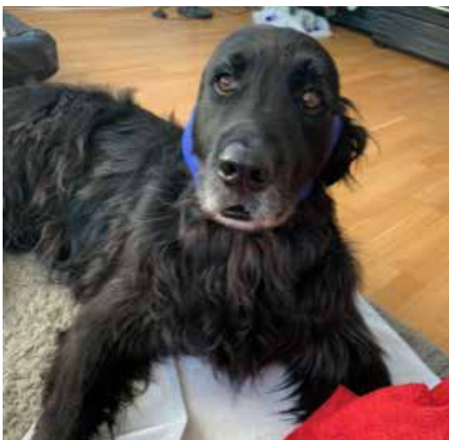
Glücklich mit dem blauen Ohrenverband

Die Nachblutung trat noch während des Saugvorgangs ein, weshalb ein Ohrenverband angelegt wurde. Nach sechs Stunden war die Blutung beendet. Zwei Wochen später rief die Besitzerin erfreut an, das Blutohr hat sich um die Hälfte verkleinert und das harte Gewebe wurde weicher und elastischer. Dem Rücken halfen die Egel nicht nur beim Ohr, sondern wirkten auch Entzündungshemmend auf seine Arthroseschmerzen. Er bewegte sich besser und hatte wieder angefangen zu spielen auf dem Spaziergang. Eine zweite Behandlung wird in ca. vier Wochen erneut durchgeführt.