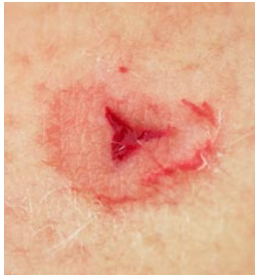
Biss des Blutegels

Der Medizinische Blutegel ( Hirudo medicinalis ) gehört ebenso wie der Regenwurm zur Gruppe der Ringelwürmer und ist im Süßwasser beheimatet. Ausgewachsene, langgestreckte Exemplare können bis zu 15 cm lang werden. Blutegel sind von Natur aus Zwitter. Für die Fortpflanzung brauchen sie allerdings einen Partner. Die Musterung und Färbung ist im vollgesaugten Zustand am besten zu sehen. Während des Saugvorgangs kann ein Egel je nach Grösse 6–8 ml Blut trinken, bei der anschließenden Nachblutung kommt es zu einem Verlust von 15–20 ml Blut.