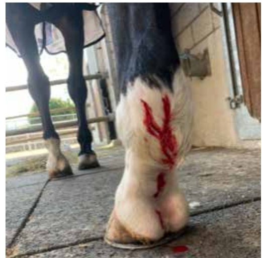
Typische Nachblutung (Sickerblutung)