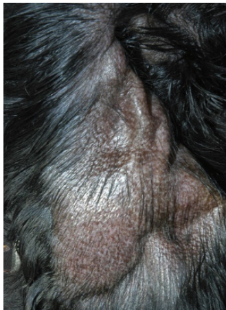
Blutohr beim Hund

Bei meinem Besuch war das Hämatom schon zwei Monate alt und war mittlerweile an die Ohrspitze gesunken. Es fühlte sich hart an und es begann sich